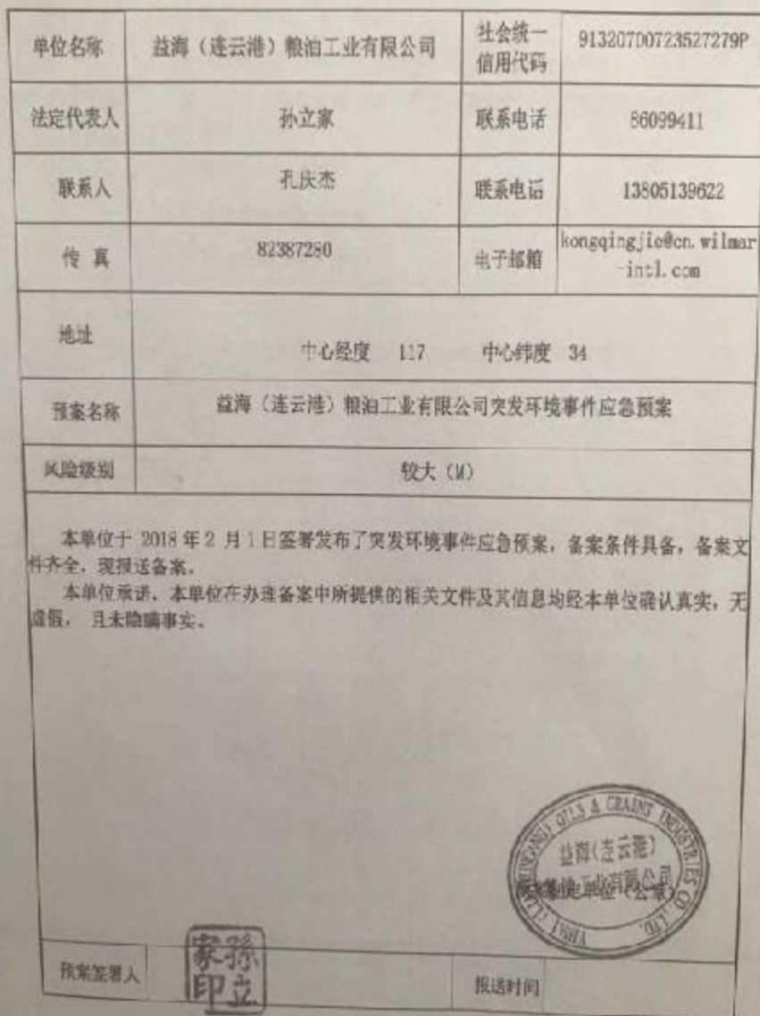
企业事业单位突发环境事件应急预案备案表